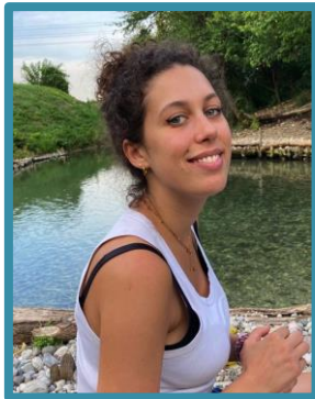
Brotto Alice Scuola dell'Infanzia e Prolungo